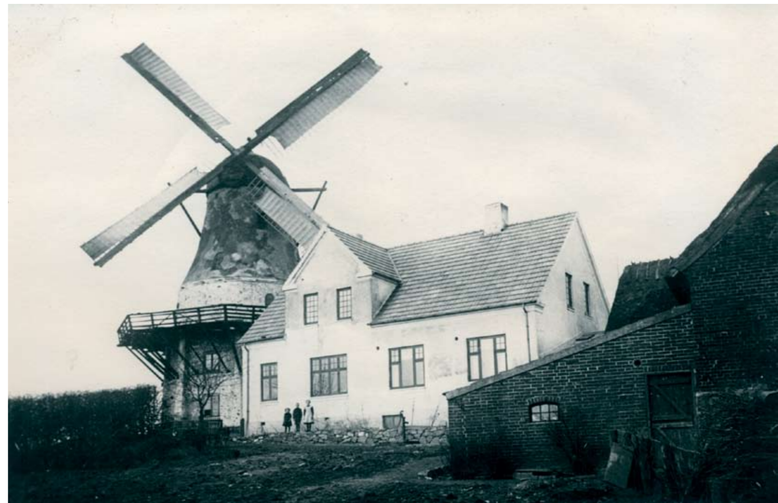
Billedet er fra 1913/1914. Det er taget kort efter, at stuehuset blev bygget med bageri i kælderen. Den ældste af børnene må være Ingeborg, dernæst Rasmus, og den yngste må være Alma, som lagde stemme til: Tre slægtled på Egebjerg Mølle gennem 100 år.

Der skulle også bæres brænde ned til at fyre med. Til ovnen blev der brugt lange kløvede træstykker på ca. 1 til 2 meters længde. De blev om aftenen lagt ind i den halvt afkølede ovn med en "Skydsel". Det blev